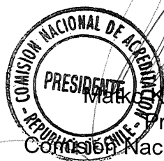
Marek Moljatic Maroevic Presidente Comisión Nacional de Acreditación